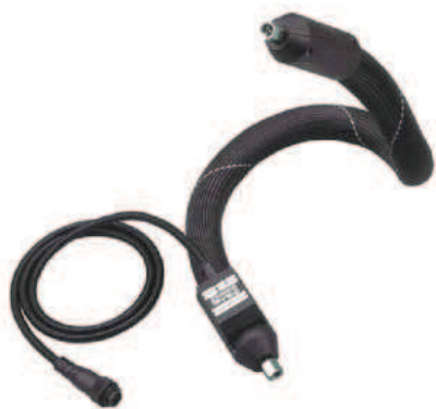
Heizschläuche der Serien H 100/H 700/H 200/ H 800 werden zum wärmeverlustfreien Transport von Öl, Fett, Wachs, Harz, Teer, Farbe, Wasser, Kohlensäure, Kunststoff, Vergussmasse usw. eingesetzt

Das Heizschlauch-Spektrum von Hillesheim reicht von sehr kleinen Nennweiten (DN2) bis hin zu DN250 in der Verladetechnik. Dabei sind Einsatztemperaturen von der Frostschutzanwendung bis hin zur Hochtemperatur-Abgasmessung bei bis zu +600 °C möglich. Der Hersteller arbeitet bereits seit mehr als 35 Jahren an der Projektierung und Umsetzung kundenbezogener Schlauchlösungen. Die Anwender kommen aus den unterschiedlichsten Industriebereichen.