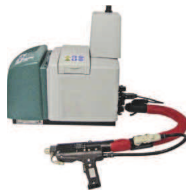
Ersatzschläuche der Serie H 200 Spezial für Klebstoffauftragsysteme sind für alle gängigen Hot-Melt-Auftragsanlagen erhältlich

B ei einem Großteil seiner Heizschläuche setzt Hillesheim Grundschräuche aus Fluorkunststoffen (PTFE, FEP PFA) ein und kann damit elektrisch beheizte Leitungen bis +250 °C realisieren. Der hierbei zulässige maximale Betriebsdruck ist sehr stark von der Nennweite abhängig und kann bis zu 400 bar reichen. Schläuche aus anderen Werkstoffen, wie zum Beispiel Edelstahl, Polyamid, Silikon oder Natur- und Synthetik-Kautschuk, spielen eben-