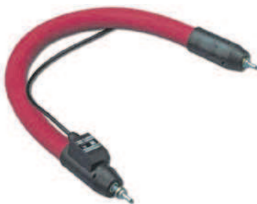
Analyse-Messgasleitung mit austauschbarer PTFE-Innenseele und verschraubter Armatur, Serie H 300 C