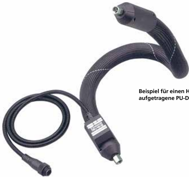
Beispiel für einen Heizschlauch für per Roboter aufgetragene PU-Dichtungsmassen.