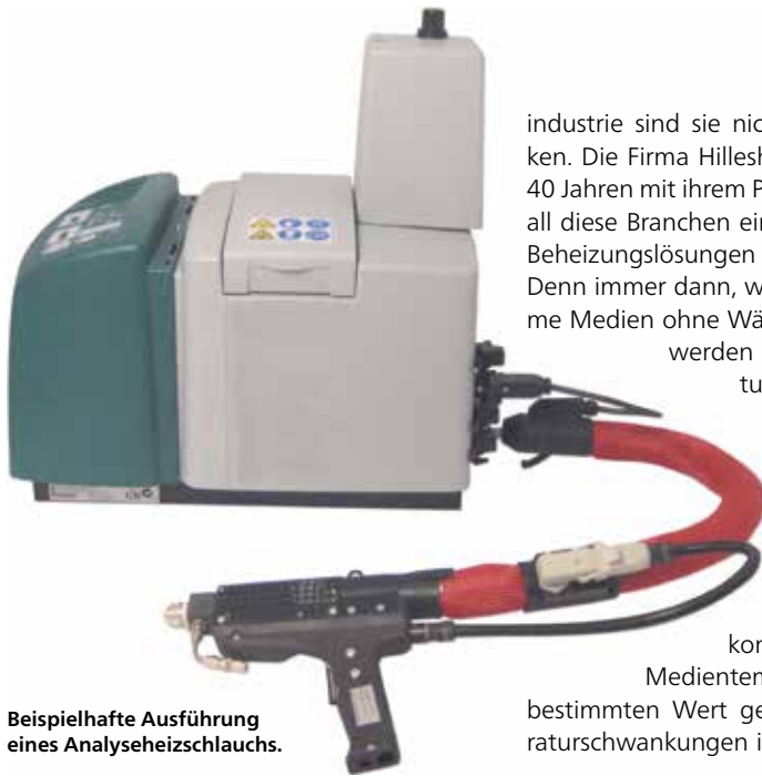
Beispielhafte Ausführung eines Analyseheizschlauchs.

industrie sind sie nicht mehr wegzudenken. Die Firma Hillesheim bietet seit über 40 Jahren mit ihrem Produktprogramm für all diese Branchen eine breite Palette von Beheizungslösungen an.