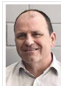
Autor: Manfred Baumgart Vertriebsleiter Hillesheim GmbH 68753 Waghäusel www.hillesheim-gmbh.de

Besonders wichtig ist dabei die Temperaturabstimmung der elektrischen Heizelemente untereinander sowie die Verbindung zur Steuer- und Regeltechnik. Der Einsatz moderner digitaler Technik ist hier selbstverständlich. Je nach Kundenanforderung kann die Temperaturregelung auch mit dem Regelgerät »HTI« realisiert