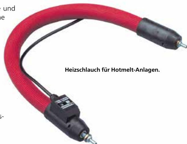
Heizschlauch für Hotmelt-Anlagen.

Klebstoffe werden nicht nur im Automobilbau und der Kunststoffverarbeitung eingesetzt, auch in Buchbindereien, in der Möbelfertigung oder in der Verpackungs-